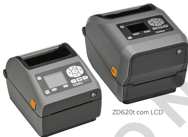
ZD620d com LCD

Quando qualidade de impressão, produtividade, flexibilidade de aplicações e simplicidade de gerenciamento são importantes, a ZD620 mostra resultados. Como a nova geração da linha de mesa da Zebra, a ZD620 substitui as populares impressoras da Série GX e a ZD500 da Zebra, ficando acima das impressoras de mesa comuns com qualidade de impressão Premium e recursos de ponta. Disponível nos modelos de transferência térmica direta e térmica, assim como modelos específicos para a área da saúde. Com mais recursos padrão que qualquer impressora de mesa da Zebra, a ZD620 foi criada para atender a uma ampla variedade de aplicações padrão. Com uma interface opcional de 10 botões com tela LCD colorida, você não precisa adivinhar a configuração e o status da impressora. A ZD620 usa o Link-OS® e nosso poderoso pacote de aplicativos, utilitários e ferramentas de desenvolvedor Print DNA, que oferece uma experiência de impressão superior com melhor desempenho, gerenciamento remoto simplificado e fácil integração. A ZD620 da Zebra: oferecendo a velocidade de impressão, qualidade de impressão e gerenciabilidade de que você precisa para continuar suas operações.