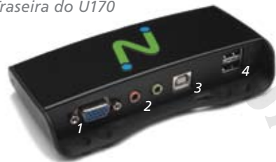
Traseira do U170