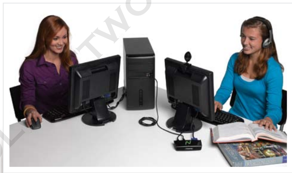
O U170 é ideal para salas de aula, acesso público, pequenas empresas, assinatura digital e uso doméstico.

A virtualização de desktop não precisa ser complexa. Nem cara. Ao contrário de outras soluções de virtualização de desktop, a NComputing não precisa de servidores nem de infraestrutura cara e complicada. Na verdade, o vSpace foi projetado para compartilhar, de forma eficiente, os ciclos de CPU normalmente desperdiçados em PCs padrão de baixo custo. Em uma solução NComputing, o vSpace cria vários espaços de trabalho virtuais em um único computador físico, e os usuários adicionais conectam seus monitores, teclados e mouses através de um simples dispositivo de acesso. Com o U170, não poderia ser mais fácil conectar o dispositivo de acesso ao computador compartilhado: basta encaixar um no outro com o cabo USB incluído.