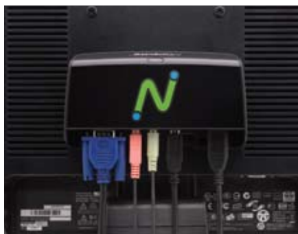
Furos de montagem de 75mm e 100mm compatíveis com VESA (parafusos de montagem incluídos)